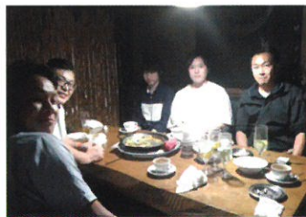
川越の『すべいん亭』にて

今期より、弊社にとってはじめてとなる新卒採用を開始しました。会社の規模からいいますと、新卒採用に踏み切るには少し早いといえるかもしれませんが、人柄が素晴らしく将来が楽しみな2名が入社を決めてくれました。右の写真ははじめての懇親会での一枚です。皆様のご指導をなにとぞよろしくお願いいたします。