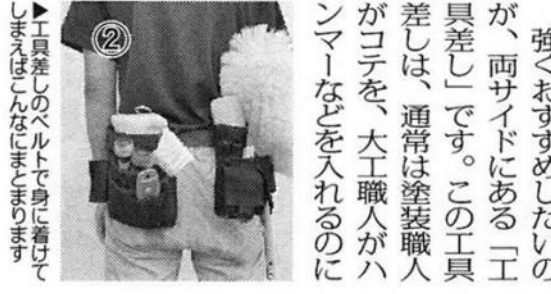
▶工具差しのベルトで身に着けてしまえばこんなにまとまります

強くおすすめしたいのが、両サイドにある「工具差し」です。この工具差しは、通常は塗装職人がコテを、大工職人がハンマーなどを入れるのに適しています。