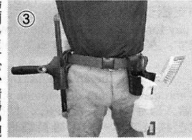
使用しますが、清掃の現場でもこれが活躍します。

清掃の極意三カ条 【壹】腰袋を活用し動きのムダをなくすべし 【貳】「工具差し」で効率アップを図るべし 【参】使い勝手に合わせカスタマイズすべし